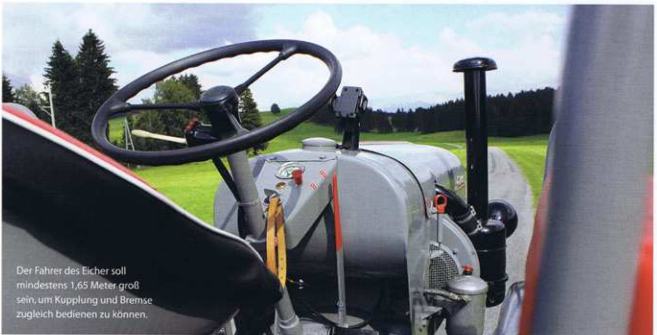
Der Fahrer des Eicher soll mindestens 1,65 Meter groß sein, um Kupplung und Bremse zugleich bedienen zu können.