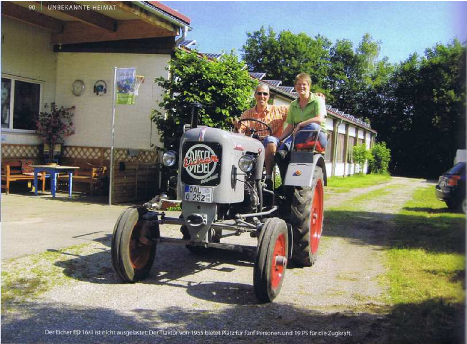
Der Eicher ED 16/II ist nicht ausgelastet: Der Traktor von 1955 bietet Platz für fünf Personen und 19 PS für die Zugkraft.